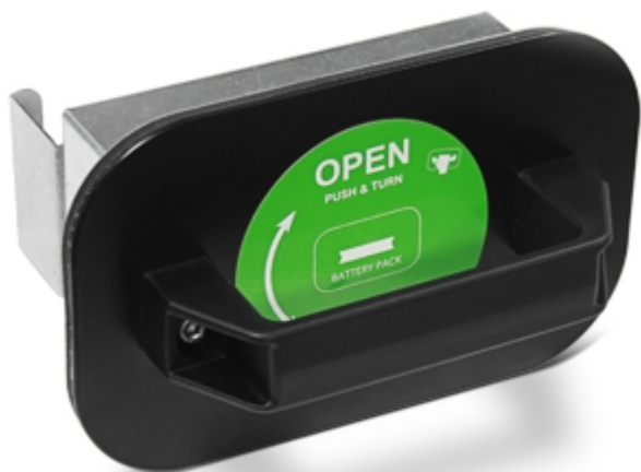
Batteria ricaricabile estraibile.