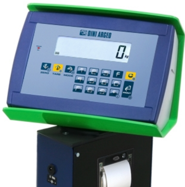
Testa girevole di serie +/-160°.