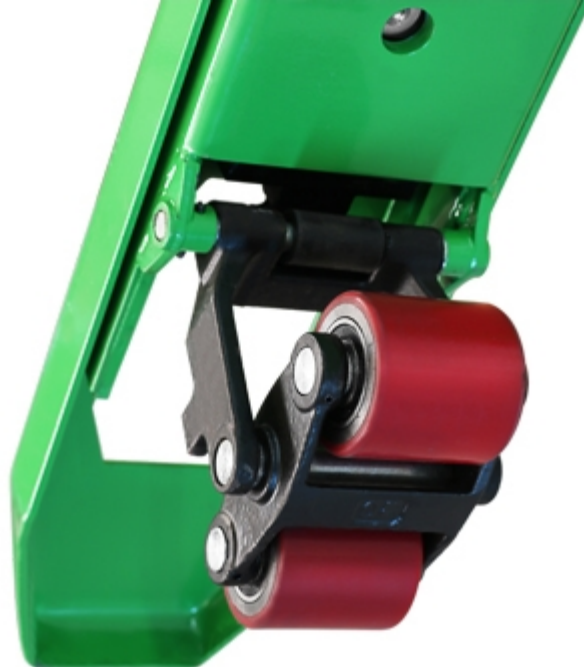
Forche chiuse nella parte inferiore, per aumentare la protezione dallo sporco.