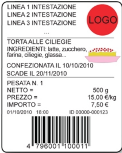
Esempio di etichetta

SOCIETA' BILANCI AI PORRO S.R.L. Via Meda, 16 20037 Paderno Dugnano (MI) ITALY Tel: +39 (0)2 9186517 Fax: +39 (0)2 9180462 info@bilanceonline.it